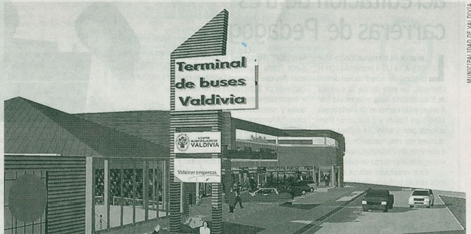
Esta sería la vista del edificio desde Anfiñón Muñoz. La concesionaria busca mejorar también el servicio de taxis autorizados.