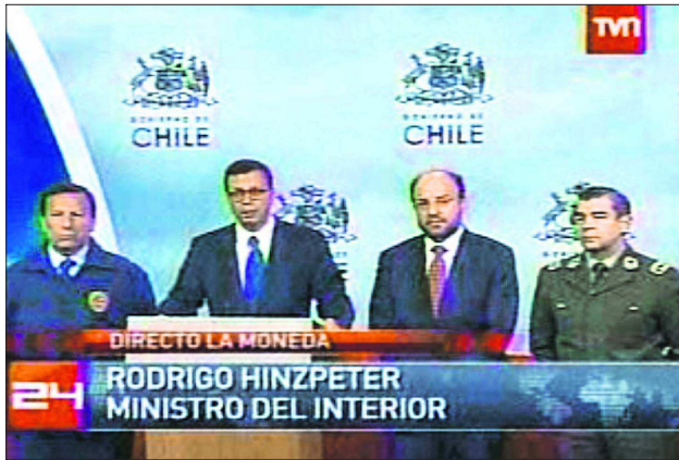
ANUNCIO.— Hinzpeter realizó el anuncio pasado la medianoche. Estaba acompañado por el canciller y jefes de ambas policías. Se supuso que el Gobierno, incluso, contrató un estudio de abogados para asesorarse en Argentina.