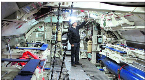
El interior de la nave se repintó con sus colores originales, al igual que sectores que presentaban niveles de corrosión. En la fotografía, la sala de torpedos.